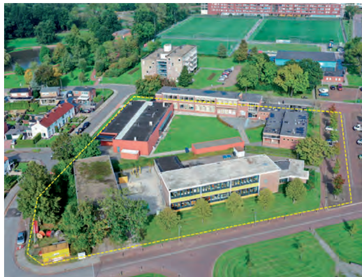
Omtrek plan Jan Ligthart

Op de Jan Ligthartlocatie komen 25 ruime gezinswoningen en 8 levensloopbestendige woningen. Alle woningen worden verhuurd door Acantus. Meer informatie over deze woningen (aantal woningen, woningtypes enzovoorts) kunt u vinden op www.thuisindelfzijl.nl .