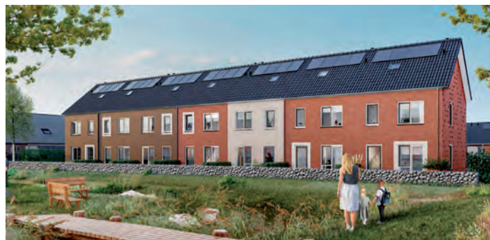
Artist impression Landenbuurt fase 1

De garageboxen zijn gesloopt en het terrein wordt bouwrijp gemaakt. In december begint de bouw van de 20 huurwoningen en 20 koopwoningen. Later volgen de 18 zorgwoningen. Alle woningen zijn naar verwachting eind 2024 klaar. Er zijn nog enkele woningen te koop. Informatie daarover vindt u op www.landenbuurt.nl .