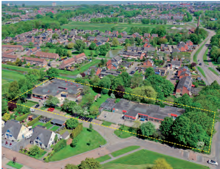
Omtrek plan 't Zigt en Zaaier

Voor de locatie 't Zigt en De Zaaier zijn twee bijeenkomsten geweest met mogelijk geïnteresseerden in het zelf laten bouwen van woningen. Dat heet Collectief Particulier Opdrachtgeverschap (CPO). De conclusie van deze bijeenkomsten was dat zo'n aanpak voor betrokkenen veel haken en ogen heeft en dat hieraan te veel (financiële) risico's verbonden zijn. De gemeente gaat nu samen met BVZ en enkele omwonenden op zoek naar een geschikte projectontwikkelaar. Deze dient in samenwerking met mogelijke toekomstige kopers een plan te maken met ruimte voor individuele wensen. Op deze locatie komen 12 half vrijstaande koopwoningen. In 2024 maakt de projectontwikkelaar een uitgewerkt plan, zodat de woningen in 2025 gebouwd kunnen worden.