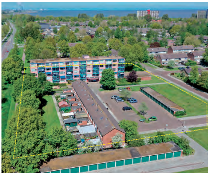
Omtrek plan Landenbuurt fase 2

Voor deze locaties komen nieuwe bestemmingsplannen. De ontwerp-bestemmingsplannen liggen 6 weken ter inzage vanaf begin december. Op de Vikinglocatie komen 24 ruime eengezinswoningen. In Landenbuurt fase II komen 23 eengezinswoningen en 7 levensloopbestendige woningen, deze woningen krijgen een slaapkamer en badkamer op de begane grond.