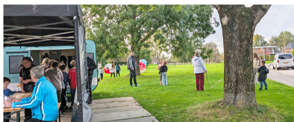
Jongeren vermaakten zich in plastic ballen tijdens de Wijkbeleving in oktober