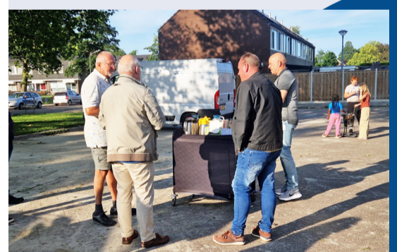
Met Elkaar in Kleine Belt