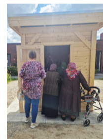
De blokhut voor tuingereedschap in de Schrijversbuurt