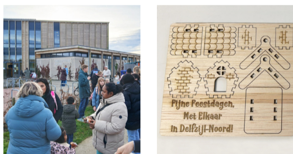
Kinderen, ouders en wijkwerkers dronken warme chocomel met kerst