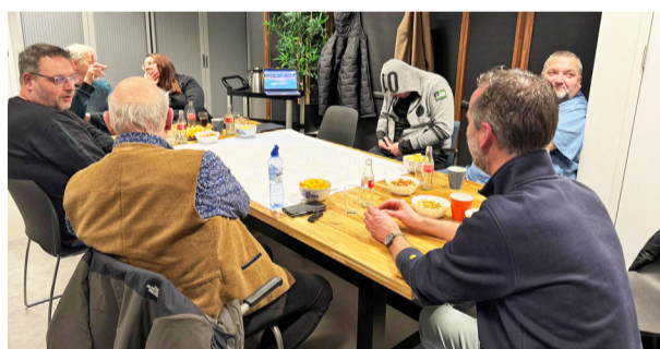
Bewoners van Kleine Belt maken samen plannen voor hun buurt