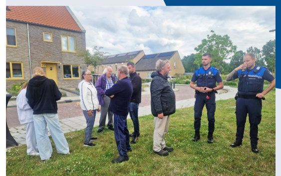
Met Elkaar in de Vestingbuurt