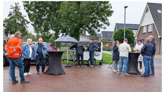
Met Elkaar in Kwelderland