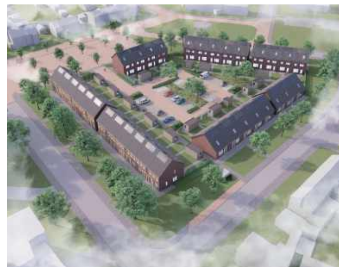
Impressie Jan Lighthart locatie

Waar jarenlang OBS Jan Lighthart stond, komt nu een nieuwe buurt. De gemeente heeft de school gesloopt, Acantus en Trebbe NoordOost B.V. bouwen hier verder. Er komen 33 huurwoningen en op het binnenterrein een gemeenschappelijke parkeerplaats met veel groen. 25 gezinswoningen en acht levensloopbestendige woningen, waarvan drie volledig WMO-geschikt. De huurwoningen zijn naar verwachting in het tweede kwartaal van dit jaar klaar. De bewoners die een woning hebben geaccepteerd ontvangen een uitnodiging om hun woning te bekijken zodra de woning bijna klaar is.