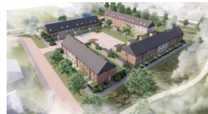
Impressie Landenbuurt fase 2

Half september vorig jaar is Trebbe NoordOost B.V. gestart met de bouw van 30 huurwoningen in de Landenbuurt (fase 2). Er komen 23 eengezinswoningen en 7 levensloopbestendige woningen. In het derde kwartaal van dit jaar levert Trebbe NoordOost B.V. de huurwoningen op aan Acantus.