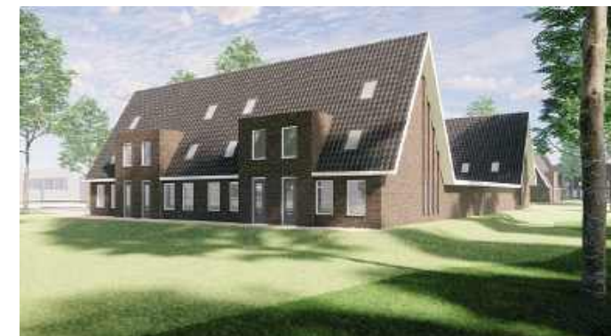
Impressie Viking locatie

Naar verwachting start VDM woningen in opdracht van Acantus in mei met de bouw van 24 gezinswoningen op de Viking-locatie. Als alles volgens plan verloopt, zijn de huurwoningen in het tweede kwartaal van 2027 klaar.