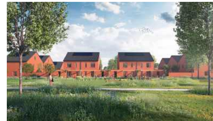
Impressie Park Delfzicht

De bouw van 135 woningen Park Delfzicht is al lange tijd in volle gang en het einde komt inmiddels in zicht. De laatste woningen worden in het tweede kwartaal van dit jaar door Plegt Vos opgeleverd. Acantus heeft nog een aantal huurwoningen over. Heeft u interesse? Neemt u dan contact op met uw bewonersconsulent.